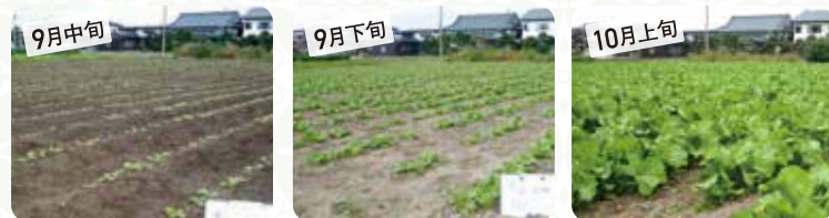
種まき後、約15日の青菜の生育状況。ここから葉がどんどん大きくなっていきます

青菜漬の風味をそのままに、食べきりサイズにパックしました。お土産や、ご贈答としてもご好評をいただいております。